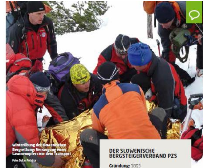
Winterübung der slowenischen Bergrettung: Versorgung eines Lawinenoپfers vor dem Transport

Es war für mich eine sehr interessante Zeit, während der ich viel bekommen habe und – so hoffe ich – auch viel geben konnte. Ich habe auch wesentlich bei der Ausarbeitung und Entwicklung der Kommission Bergsport/Ausbildung/Sicherheit mitgewirkt. Inhaltlich wurde diese