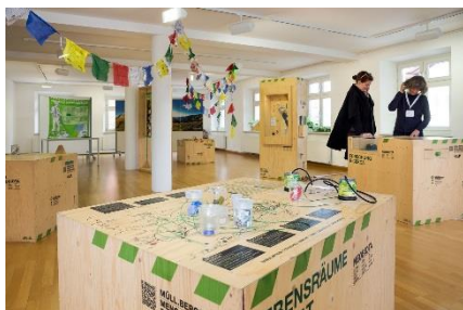
Neobiota: Foto Wolfgang Gasser

Rund um die Alpenkonferenz fand vom 11. -15. Oktober 2016 in Grassau (Deutschland) die Alpenwoche www.alpweek.org statt, die mit weit über 400 TeilnehmerInnen die Erwartungen der acht veranstaltenden Partnerorganisationen, darunter dem CAA, noch übertraf. Zahlreiche Podiumsgespräche, Sessions, Marktstände, Ausstellungen und Workshops luden zum Austausch über aktuelle Herausforderungen und gemeinsame Lösungen für eine nachhaltige Entwicklung in den Alpen, insbesondere in den Bereichen Kultur, Demografie und Lebensqualität. Der ÖAV organisierte einen Workshop zu seinem