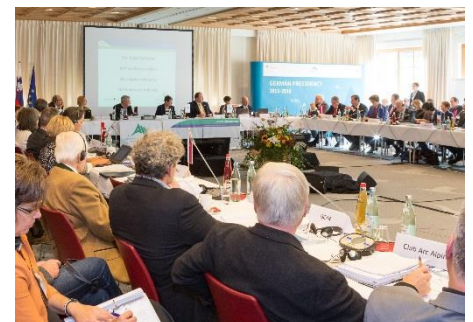
Alpenkonferenz 2016

Bei der Konferenz wurde die Präsidentschaft der Alpenkonvention von Deutschland an Österreich übergeben. Hauptthemen und Beschlüsse der Konferenz betrafen das „ Grüne Wirtschaften “, das Mehrjährige Arbeitsprogramm 2017-22 (MAP) , EUSALP , aber auch die Leitlinien bzw. Handlungsempfehlungen des Überprüfungsausschusses zur Auslegung von Art. 6 (3) des Tourismusprotokolls sowie Art. 11(1) des Naturschutzprotokolls , die nun praktischen